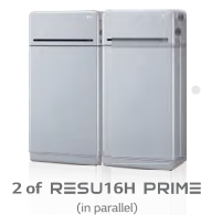
2 of RESU16H PRIME (in parallelo)

Soddisfa completamente un consumo medio giornaliero di elettricità